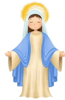
Jubiläumsfeier der Rosenkranz - Gruppe