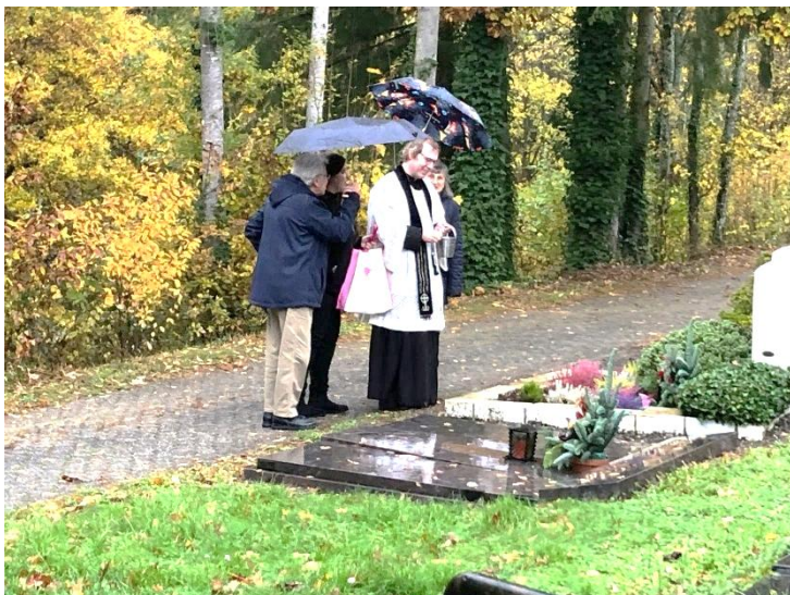
Gräbersegnung in Lauterecken bei Regen