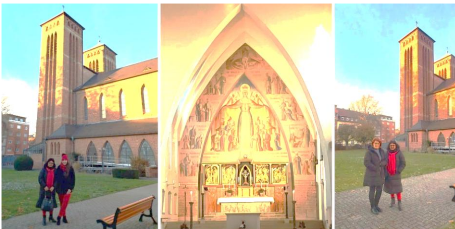
Ausflug zur Gelöbniskirche Maria Schutz, mit Hl. Messe und Beichte, anschließend Weihnachtsmarkt