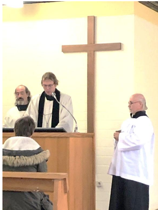
Andacht zu Allerseelen in Lauterecken