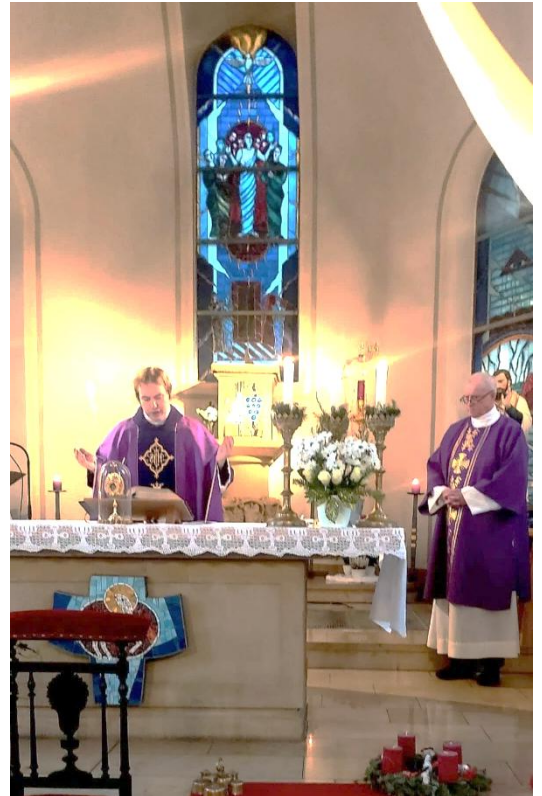
Patrozinium unserer Pfarrei Franz – Xaver und der Pfarrkirche