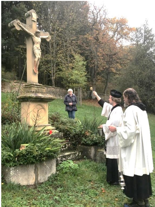
Allerseelen in Reipoltskirchen