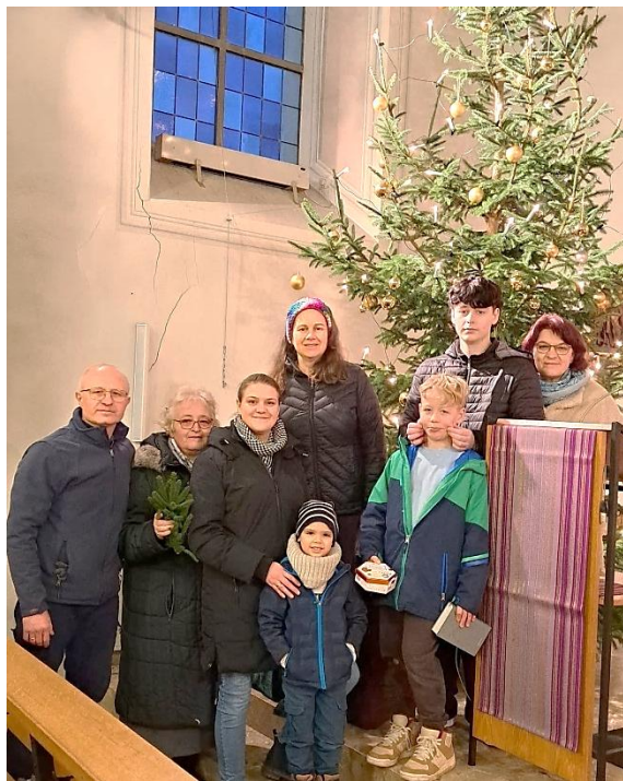
Die Helfergruppe für Baum und Krippe in Wolfstein